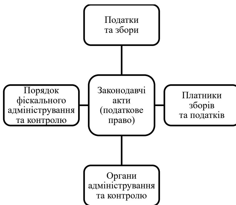
Рис. 2. Структура податкової системи країни

Формування у державі такої податкової системи, яка якісно обмежувала б ухилення від сплати податків та зборів, є сьогодні ключовим викликом для багатьох країн світу, для яких характерною стадією розвитку є перехідна економіка. І Україна не є винятком. Так, з моменту здобуття незалежності, почався процес формування власної податкової системи, а значить і розвитку фіскального менеджменту.