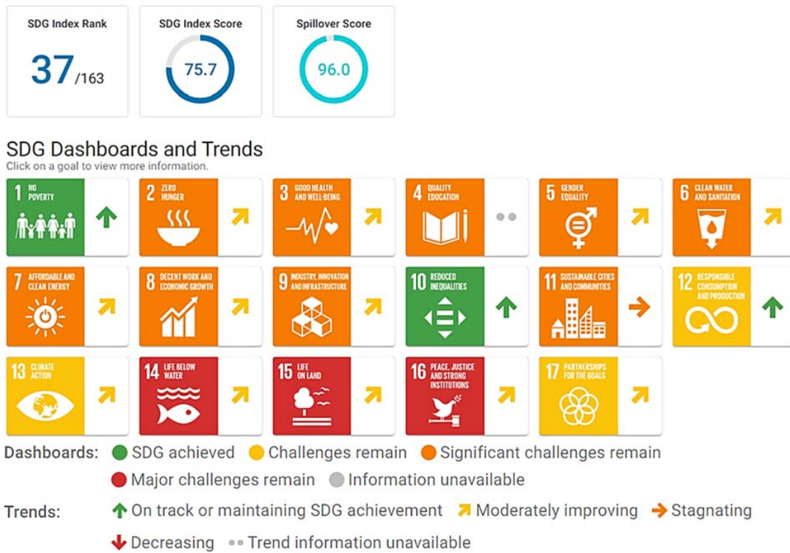
Рис. 1. Інфографіка досягнення цілей сталого розвитку в Україні у 2022 році