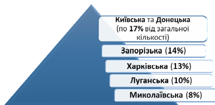
Рис. 2. Найбільша кількість зруйнованих та пошкоджених підприємств (за областями)