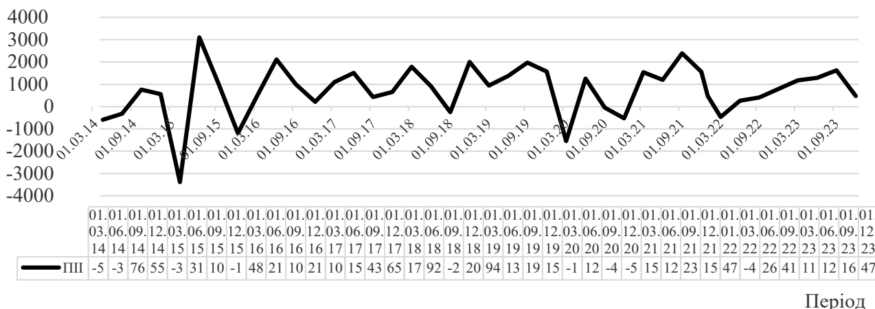
Рис. 1. Динаміка прямих іноземних інвестицій в Україну, 2014–2023 рр., млн дол. США

Прямі іноземні інвестиції (ПІІ), млн дол. США