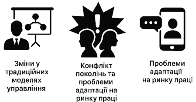
Рис. 1. Виклики для бізнесу у взаємодії з новими поколіннями