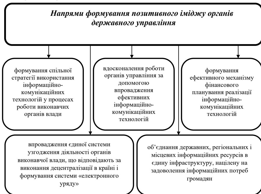
Рис. 1. Напрями формування позитивного іміджу органів державного управління

Провідним напрямом зростання ефективності державного управління у сфері утворення та функціонування «електронного уряду» є розвиток адміністративно-правових інститутів, які забезпечують максимальне досягнення соціальних інтересів та потреб громадськості. У даному контексті, визначимо основні напрями формування позитивного іміджу органів державного управління за рахунок розвитку потенціалу інформаційних технологій (див. Рис. 1).