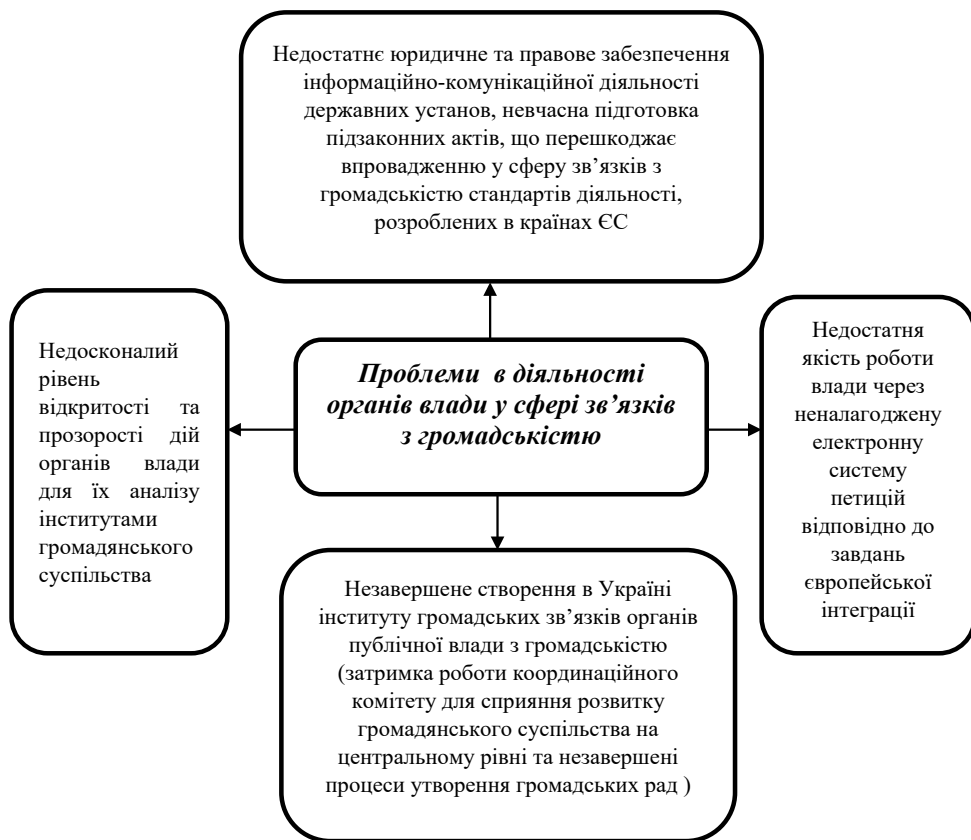
Рис. 2. Проблеми, що перешкоджають розвитку позитивного іміджу органів влади та знижують ефективність державних відносин у зв'язках із громадськістю

недостатньої сформованості демократичних традицій у роботі органів державного управління та у публічному спілкуванні, що є важливими елементами розвитку нації. Інші проблеми, що перешкоджають розвитку позитивного іміджу та знижують ефективність державних відносин у зв'язках із громадськістю, систематизовані на Рис. 2.