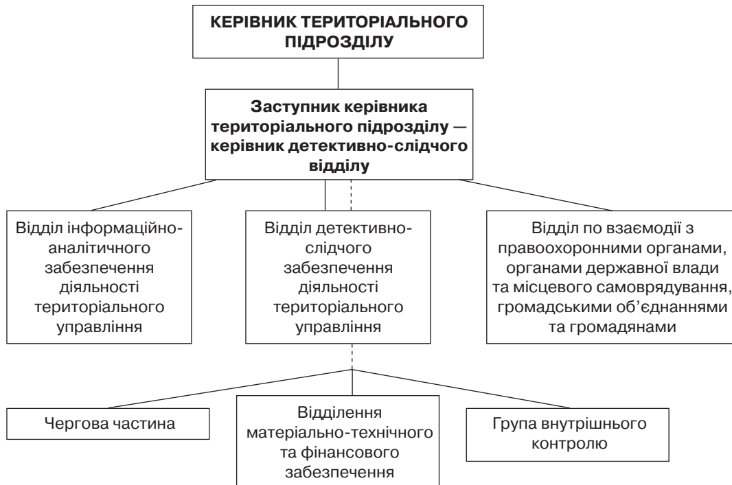
Рис. 2. Структура територіальних підрозділів ДБР (м. Львів, м. Хмельницький, м. Миколаїв, м. Мелітополь, м. Полтава, м. Краматорськ, м. Київ)

При розробленні організаційної структури ДБР слід відзначити, що територіальні підрозділи ДБР матимуть у своєму складі фахівців з аналітичної роботи, детективів, чергові частини та слідчі відділи. Ми вважаємо, що слідство по представникам окремих середовищ (правоохоронних органів, державних службовців вищого рангу, антикорупційної прокуратури та керівництва Національного антикорупційного бюро) має здійснюватися винятково слідчими підрозділами Центрального апарату.