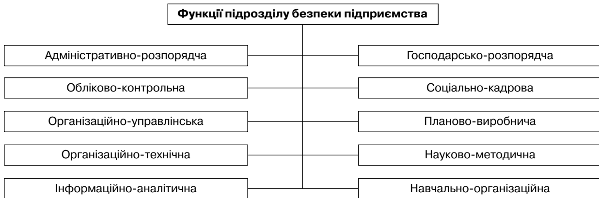
Рис. 1. Функції підрозділу безпеки

майна, засобів виробництва, сировини і готової продукції, будівель і споруд, транспортних засобів, фінансових ресурсів та інтелектуальної власності.