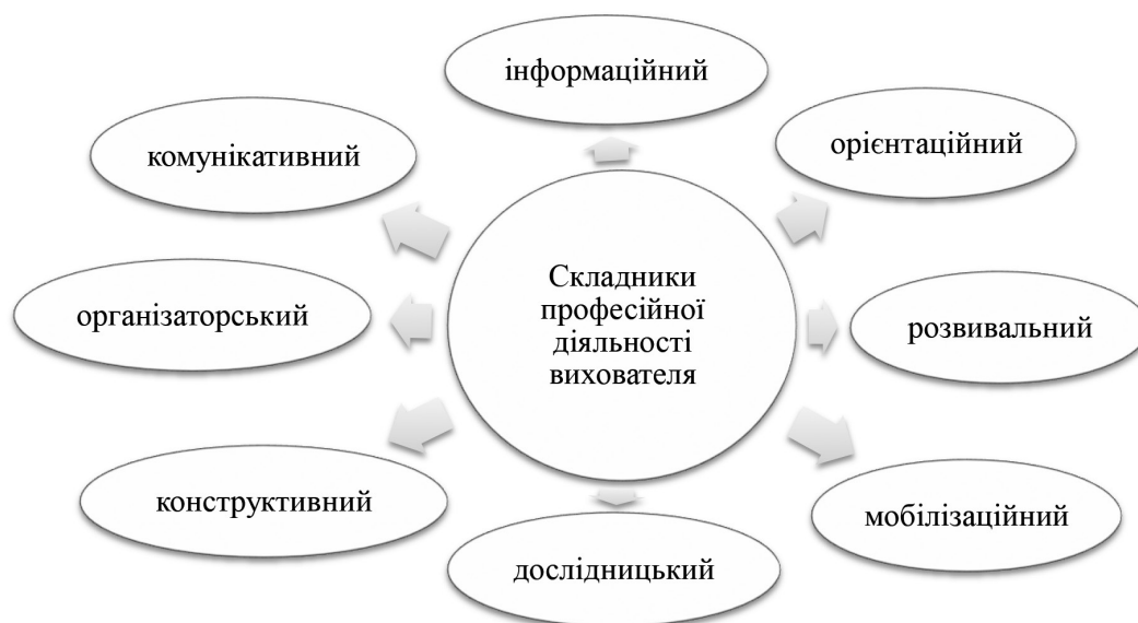
Рис. 1. Складники професійної діяльності вихователя

Отже, дитяча ілюстрація повинна бути максимально адаптована до особливостей дитячого сприйняття. Чіткість образу, продумана композиція, відповідність персонажів віковим характеристикам та грамотне використання кольору створюють умови для більш ефективного залучення дітей до читання та розвитку їхніх творчих здібностей. Ілюстрація є не просто доповненням до тексту, а повноцінним засобом пізнання, що впливає на формування уявлень, емоцій, художнього смаку дитини. Відповідно, для