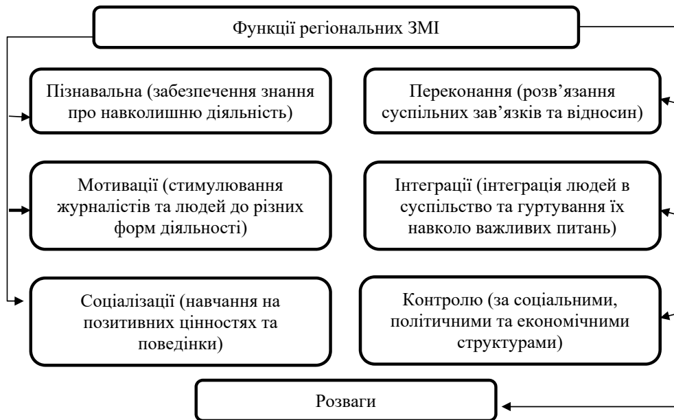
Рис. 1. Функції регіональних засобів масової інформації

ницького виходить менш регулярно; тираж останнього «було скорочено на третину» після того, як він повернувся до друку. Зменшила тираж і газета «Замкова гора» з Київської області.