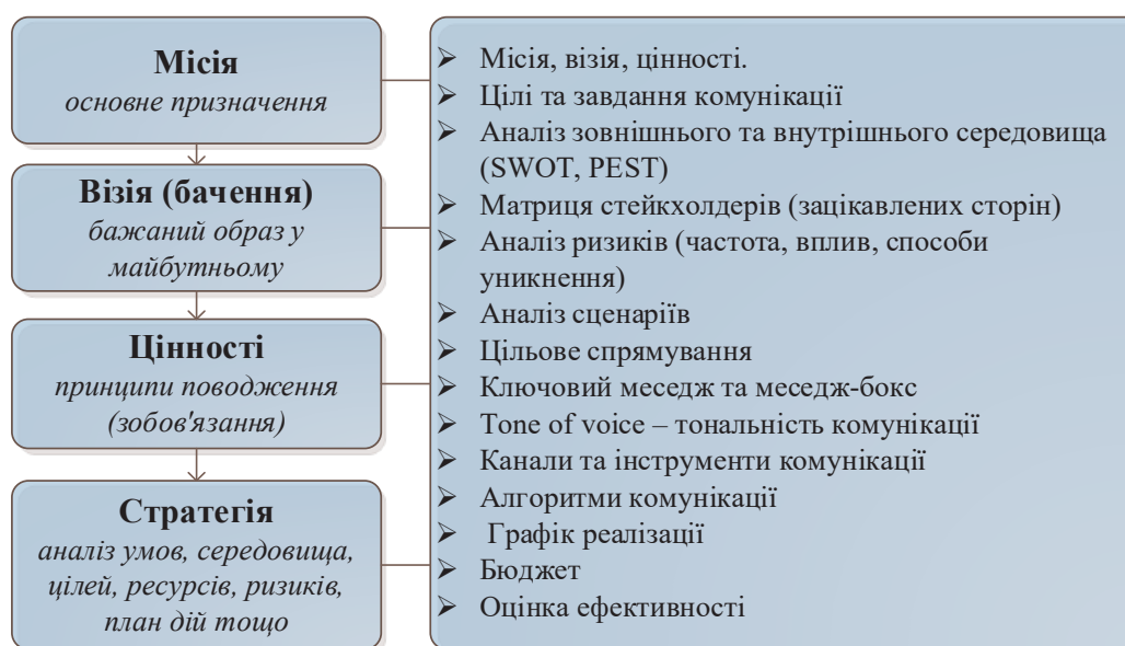
Рис. 1. Структурні складові комунікаційної стратегії

Якщо розглядати комунікаційні стратегії на рівні місцевого самоврядування з практичного погляду, варто виділити два моменти: 1) існують позитивні практики їх