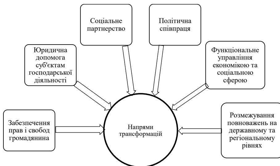
Рис. 2. Напрями трансформацій механізму державного управління розвитком регіонів, складено на основі аналізу джерела [9, с. 51]

– створення умов залучення інвестицій у перспективні напрями регіонального розвитку; – забезпечення позиціонування регіону для внутрішніх інвесторів з урахуванням перспектив його потенційних можливостей;