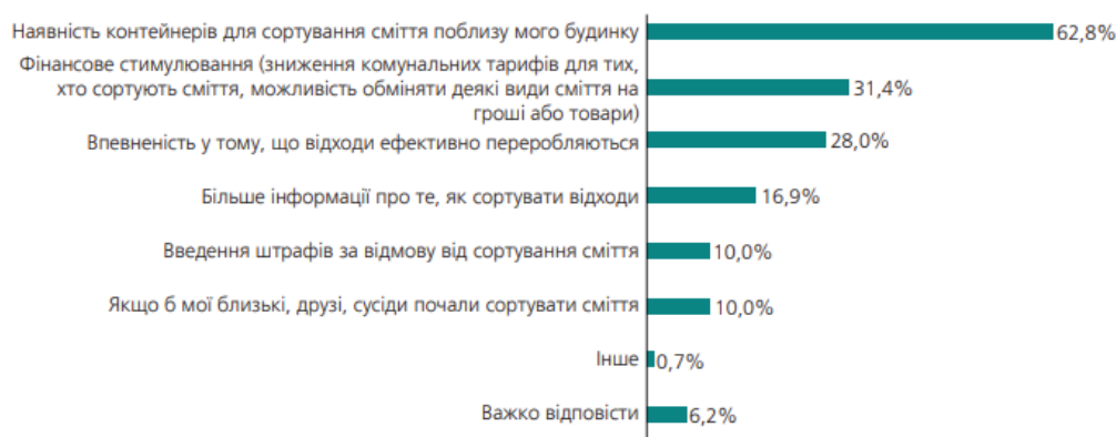
Рис. 5. Розподіл відповідей респондентів на запитання «Що змогло б переконати Вас сортувати все Ваше сміття» (респонденти могли обрати декілька відповідей; на запитання відповідали тільки ті, хто інколи сортує окремі види сміття або ніколи не сортує сміття) [1]

ського суспільства з метою забезпечення екологічної безпеки регіону і задоволення екологічних потреб населення на основі принципів соціальної справедливості, субсидіарності і солідарності». Науковець також виділяє чинники ефективності соціального партнерства у сфері екологічної політики: узгодженість нормативно-правової бази; налагоджена інформаційно-комунікаційна взаємодія суб'єктів соціального партнерства; високий рівень екологічної свідомості і громадської активності населення. Повністю підтримуючи позицію дослідника, варто зазначити про важливість організації процесу такої взаємодії [4].