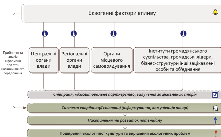
Рис. 6. Інтерпретація моделі співпраці в системі публічного управління в екологічній сфері

Висновки. Суспільство сьогодні засвідчує важливість посилення контролю за діяльністю промислових підприємств, якістю харчових продуктів, масового встановлення сортувальних контейнерів тощо. Водночас існує проблема низької публічності організацій, що займаються охороною навколишнього середовища. Сьогодні актуальні питання що стосуються співпраці в системі публічного управління в екологічній сфері потребують вирішення з урахуванням