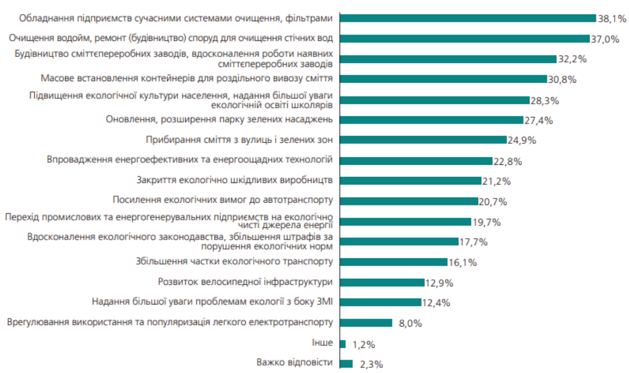
Рис. 3. Розподіл відповідей респондентів на запитання «Як Ви вважаєте, які кроки мають бути зроблені в першу чергу для покращення екологічної ситуації у Вашому населеному пункті» (респонденти могли обрати не більше п'яти варіантів відповіді) [1]