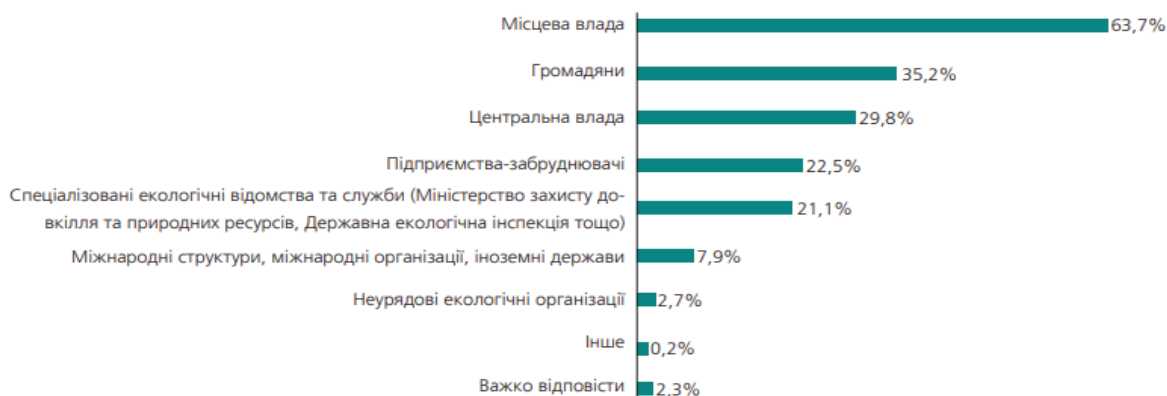
Рис. 1. Розподіл відповідей респондентів на запитання «Як Ви вважаєте, хто має нести відповідальність за покращення екологічної ситуації у Вашому населеному пункті?» (респонденти могли обрати не більше двох варіантів відповіді) [1]

Варто зауважити й те, що переважна більшість українців серед кроків, які має зробити держава для підвищення відповідальності бізнесу до екологічних проблем (респонденти могли обрати декілька варіантів відповіді), віддає перевагу посиленню екологічних вимог до підприємств і підвищенню штрафів за їхнє невиконання (60,6 %). Також 39,4 % опитаних вважають за доцільне закрити всі екологічно небезпечні підприємства, якщо