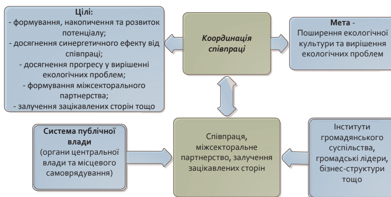
Рис. 7. Мета та цілі організації співпраці в системі публічного управління в екологічній сфері