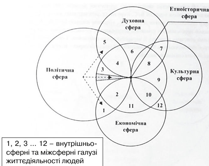
Рис. 3. Авторитетний статус політичної сфери в багатонародному суспільстві

Повернуся до хронологічного рубежу 1985 і 1986 років. Ще раз — про свою колишню “інституційну затиснутість” між партією і державою. Я дуже часто — наодинці з собою — уявляв себе перед запитальним бар’єром: Я і Влада: хто є хто? Нехай і на низовому (почасти й на апаратно-виконавському) рівні, — я не є “вільний творець” політологемних цінностей та орієнтацій... А коли так, чи міг би я колись “вказати” навіть низовим верхам (1) на безглуздість формули “п’ятирічка за чотири роки”, або (2) на недоцільність по-