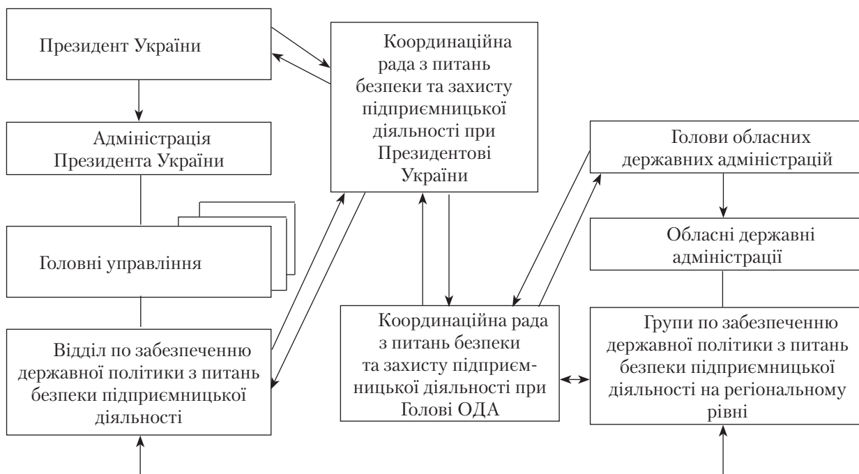
Модель формування та реалізації державної політики у сфері забезпечення безпеки підприємництва

Отже, такий підхід свідчатиме, з одного боку, про реальне формування дієвих механізмів забезпечення безпеки та захисту вітчизняного підприємництва, а з другого — свідчатиме про європейський підхід щодо створення сприятливих умов для розвитку