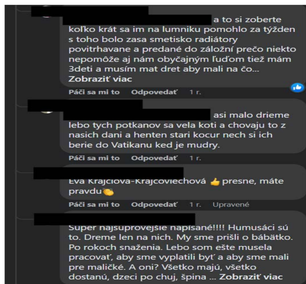
Fig. 2 part of the comments below the post regarding the visit of Pope Francis to Luník IX

[Transcription:]