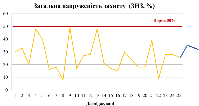
Рис. 2. Загальна напруженість механізмів психологічного захисту