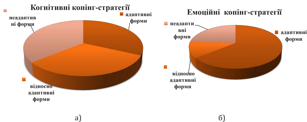
Рис. 6. Результати дослідження копінг-стратегій батьків дітей із вадами розвитку

Компенсація – це найпізніший і когнітивно складний захисний механізм, який розвивається і використовується, як правило, свідомо. Він призначений для стримування почуття смутку та горя з приводу реальної чи уявної втрати, невідповідності або неповноцінності (Василюк, 1984; Водоп'янова, 2018). Компенсація передбачає спробу виправлення або знаходження заміни цієї неповноцінності. Особливості захисної поведінки припускають установку на серйозну і методичну роботу над собою, знаходження і виправлення своїх недоліків, подолання труднощів, досягнення високих результатів в діяльності, прагнення до оригінальності, схильність до спогадів. При раціоналізації особистість створює логічні обґрунтування своєї або чужої по-