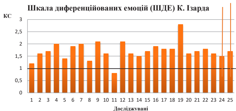
Рис. 5. Результат дослідження емоцій батьків дітей із вадами розвитку за Шкалою К. Ізарда

За шкалою «кооперація» 92,6% батьків виявляють інтерес до того, що цікавить дитину, намагаються оцінювати здібності дитини в позитивному ключі, заохочують самостійність та ініціативу дитини, значення в балах знаходяться близько до визначених за шкалою, тоді як 7,4% батьків мають низькі бали за цією шкалою і, відповідно, протилежне ставлення. За шкалою «симбіоз» 63,0% досліджуваних батьків намагається не встановлювати психологічну дистанцію між собою і дитиною, бути ближче до неї і задовольняти її основні розумні потреби, захистити від неприємностей, а 37,0% батьків – навпаки, встановлюють значну психологічну дистанцію між собою і дитиною, мало піклуються про неї (рис. 3). За шкалою «контроль» оптимально, коли рівень контролю складає 3–5 балів, такий показник мають біля третини досліджуваних. Низькі бали за шкалою «ставлення до невдач дитини» свідчать про те, дорослий вірить в неї, поділяє її інтереси, захоплення, думки і почуття – тут високий результат (по балах) показали фактично всі батьки.