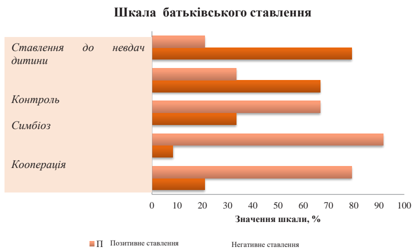
Рис. 3. Показники ставлення батьків до своїх дітей із вадами розвитку

при 24–33 балах. Негативне ставлення до дитини (в балах) продемонстрували 22,2% опитаних батьків.