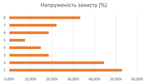
Рис. 1. Напруженість механізмів психологічного захисту (1 – заперечення; 2 – виражена проекція; 3 – витіснення; 4 – регресія; 5 – заміщення; 6 – компенсація; 7 – гіперкомпенсація; 8 – раціоналізація)

За тестом «Опитувальник батьківського ставлення» А.Я. Варга, В.В. Століна, виявлено, що за шкалою «прийняття-відкидання» позитивне ставлення до дитини виявляє 77,8% батьків, але по