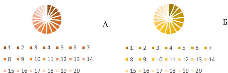
Рис. 2. Співвідношення копінгових стратегій матерів дітей з інвалідністю (А) та практично здорових дітей (Б) (1 – зниження значення стресової ситуації, 2 – самохвалення, 3 – самовиправдання, 4 – відволікання, 5 – заміщення, 6 – самоствердження, 7 – психом'язова релаксація, 8 – контроль над ситуацією, 9 – самоконтроль, 10 – позитивна самомотивація, 11 – пошук соціальної підтримки, 12 – антиципаційне уникнення, 13 – втеча від стресової ситуації, 14 – соціальна замкненість, 15 – “заїжджена платівка”, 16 – безпомічність, 17 – жалість до себе, 18 – самозвинувачення, 19 – агресія, 20 – прийом ліків)