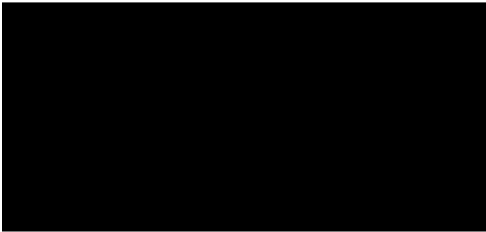
Рис. 1. Динаміка прояву цінності № 15 («щасливе сімейне життя») в період навчання у студентів ПХДПУ імені Г. Сковороди

№ 15 - щасливе сімейне життя; № 8 — наявність добрих і вірних друзів; № 3 - здоров'я фізичне та психічне. Але значущість цих цінностей різна, відповідно до курсів навчання. Наприклад, якщо цінність № 15 («щасливе сімейне життя») - загалом по університету на старших (4-5-му курсах) посідає перше місце, то на молодших (1-2-му) лише третє. Як видно на рис. 1, відстежується чітке зростання значущості такої тенденції від молодших курсів до старших. Відсоткова складова цієї цінності становить, відповідно, на молодших курсах — 55, 51 %, 59, 83 %, а на старших — 75,45%. Цінність № 8 («наявність добрих і вірних друзів»), у порівнянні з попередньою, має зворотну тенденцію: на молодших курсах (1-2-му) її значущість сягає першого плану (відсоткове співвідношення — 78,53%, 65,61%), на випускному (5-му) курсі студенти за значущістю цю цінність опустили на четверте місце (60,82%). Цей факт пояснюється тим, що на молодших курсах студентам, які намагаються адаптуватися до нового середовища, дуже важливо мати підтримку вірних друзів. Студенти старших курсів воліють бути поряд із коханою людиною, ніж знайти підтримку серед друзів. Динаміка прояву цієї цінності подана на рис. 2.