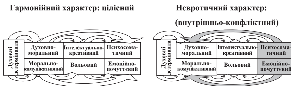
Рис. 3. Схема взаємозв'язків між компонентами характеру особистості (розробка автора).

Обговорення результатів дослідження. На основі інтерпретації усіх кореляційних та регресій-