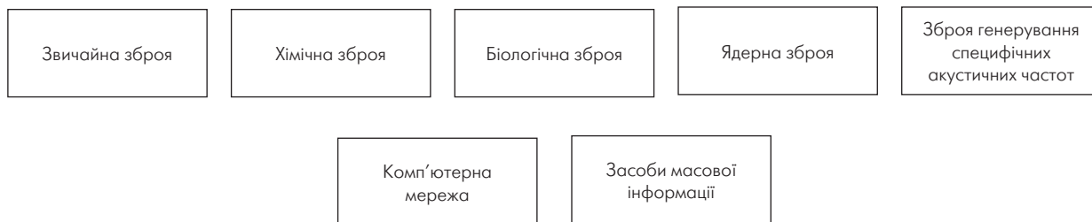
Рис. 2. Можливі засоби сучасного тероризму

Ядерні матеріали як і раніше ходовий товар на чорному ринку на території держав, які входили до колишнього СРСР. Їх можна вилучити з радіоактивних відходів, а також видобути в процесі заходів із ліквідації ядерних ракет та інших видів ядерної зброї, яка в плані можливості використання терористичними осередками є особливою проблемою. Адже неконтрольовані одиниці міжконтинентальних ракет лишилися як на території колишнього СРСР, так і в країнах Заходу [11]. До групи ризику входить також можливість викрадення боеприпасів, які вміщують збіднений уран, зокрема використані військами НАТО у Косові і тому доступні для членів Косовських терористичних угруповань та аналогічних формувань