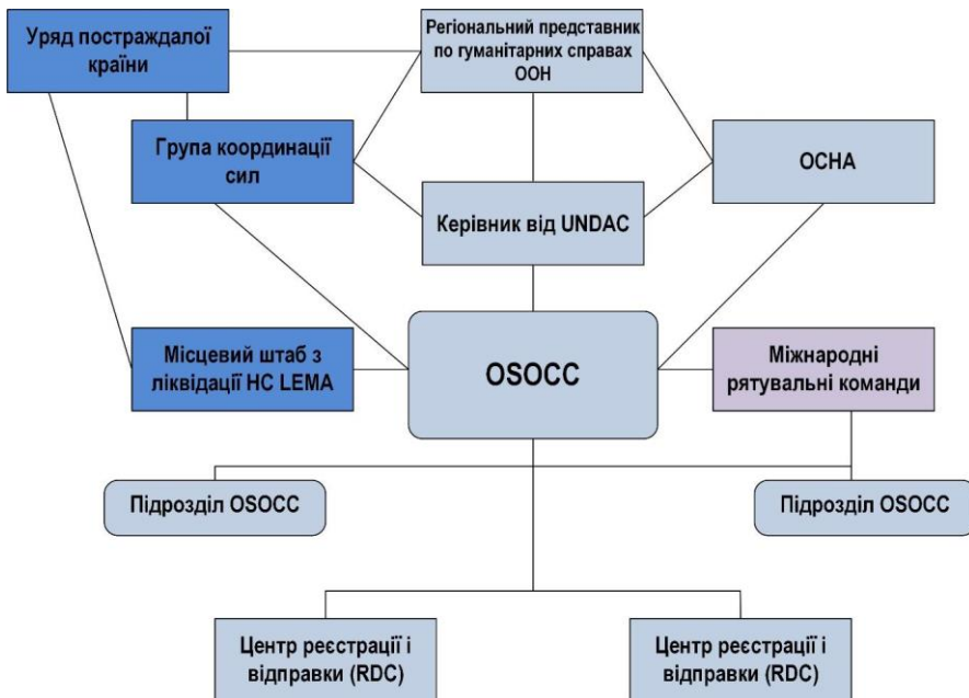
Рисунок 3 – Організація взаємодії OSOCC

Весь особовий склад OSOCC має чітко розуміти їхні конкретні ролі та очікувані результати. Однак весь особовий склад OSOCC має також розуміти завдання інших функціональних елементів, а також, як діяльність кожної людини стосується інших. Важливо приділити достатньо часу для планування організації OSOCC. Потрібно чітко визначити ролі, завдання та очікувані результати членів організації, а також їх взаємодію.