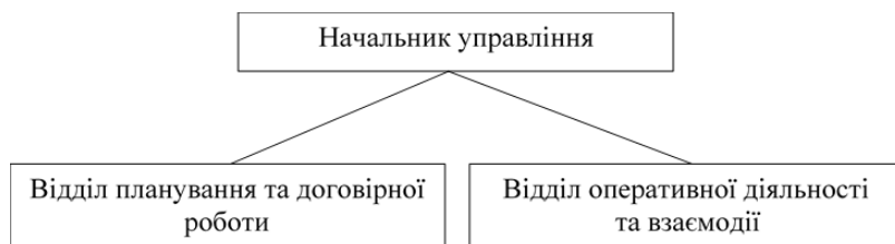
Рисунок 1 – Типова структура управління ЦВ

управління ЦВС Об'єднаного командування ЗС НАТО «Брюнссум» включає два відділи (див. рис. 1, розглянуто в [3, с. 15]).