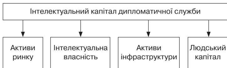
Рис. 1. Структура інтелектуального капіталу компанії (Е. Брукінг, Е. Мотта) Джерело: [2].

Активи ринку — це нематеріальні активи дипломатичної служби, що визначають її положення на ринку