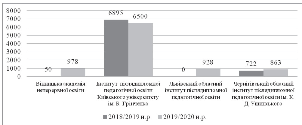
Рис. 3. Порівняльний аналіз кількості виданих документів про підвищення кваліфікації за дистанційною формою навчання у закладах післядипломної педагогічної освіти України у 2018/2019, 2019/2020 навчальних роках