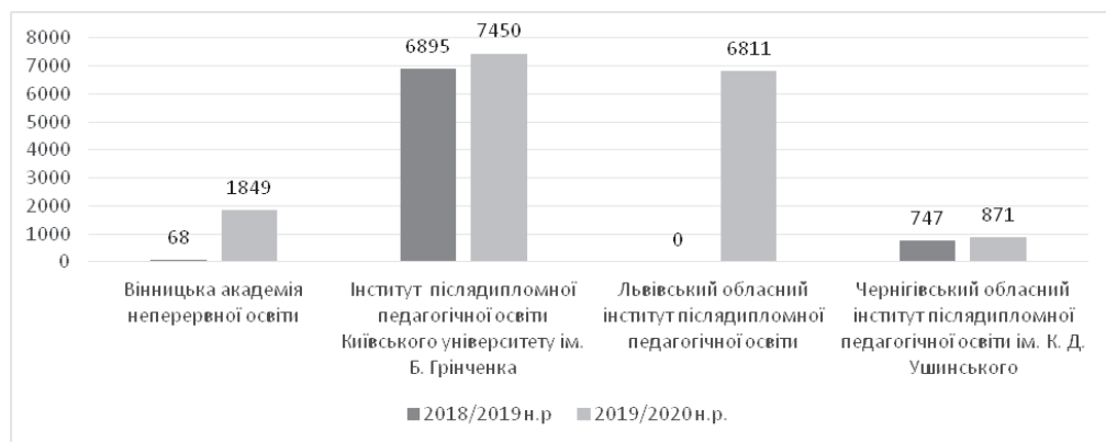
Рис. 1. Порівняльний аналіз кількості заявок слухачів на дистанційні курси у закладах післядипломної педагогічної освіти України у 2018/2019, 2019/2020 навчальних роках

Порівняльний аналіз кількості заявок на дистанційні курси у закладах післядипломної педагогічної освіти України у 2018/2019, 2019/2020 навчальних роках представлено у вигляді діаграми на рис. 1.