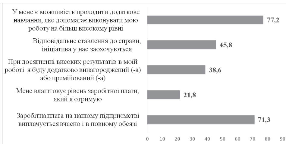
Fig. 1. Level of motivation and stimulation of work of the healthcare workers of the CPHC No. 2 (%)

Table 2 illustrates the level of corporate culture in CPHC No. 2. Thus, 64 % of respondents believe that the team is friendly and close-knit. In case of contradictions or conflicting points in