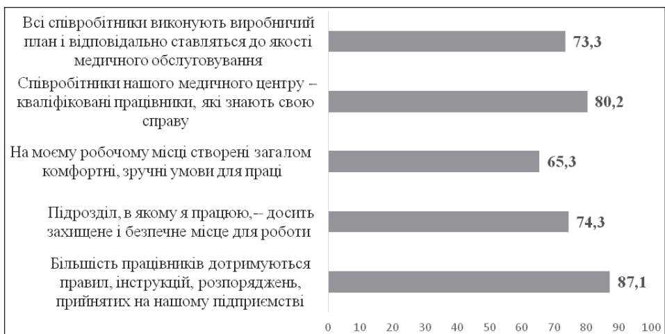
Fig. 2. Satisfaction with working conditions and observance by the medical workers of the current normative-legal acts regulating activity of the CPHC No. 2 (%)

the group, 71 % of respondents always manage to overcome the differences. 76 % consider themselves to be a member of the unified team of CPHC No. 2. 79 % of respondents believe that interaction with the immediate leader is built freely and openly. 58 % of respondents believe that the leadership of CPHC No. 2 builds with the employees fair, open relations.