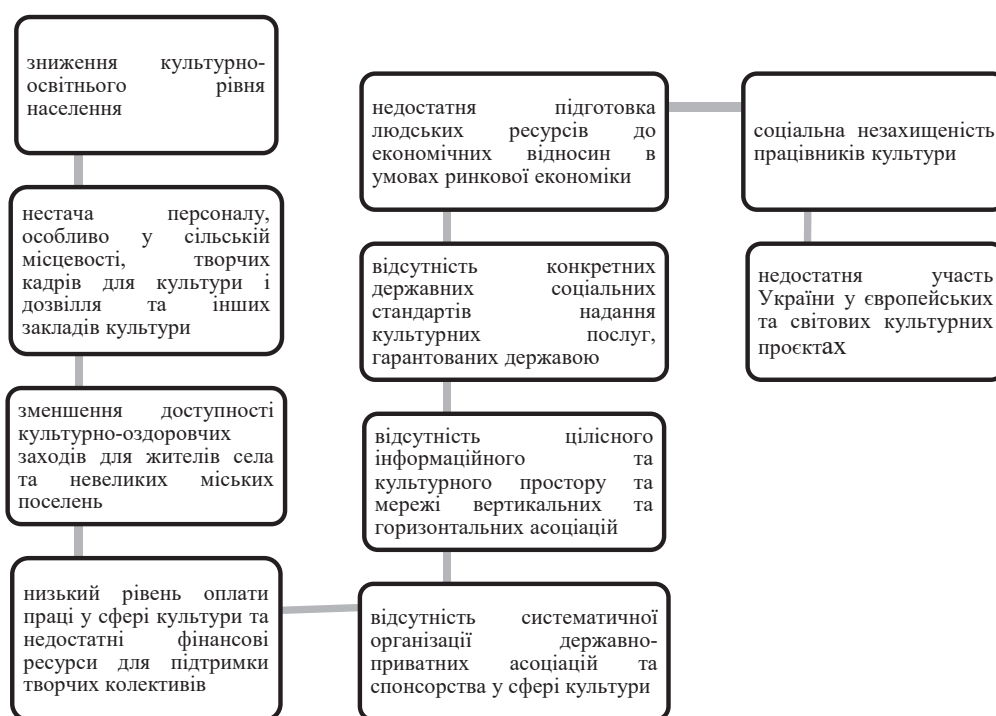
Рис. 2.2. Невирішені питання у сфері розвитку культури. Побудовано автором за джерелом (Терлецький, Батанправа, 2022).

Отже, сьогодні є безліч проблем реалізації культурних прав людини. Для того, щоб виправити ситуацію, що склалася, необхідно