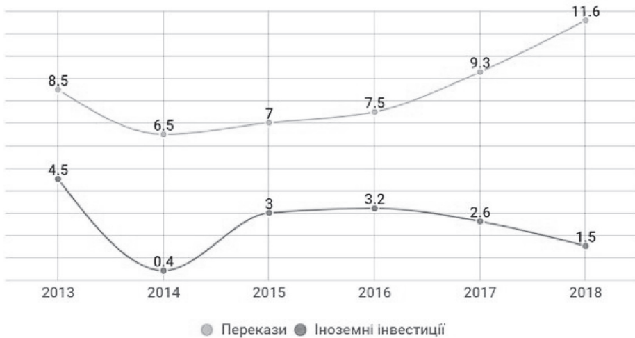
Рис. 2. Грошові перекази та іноземні інвестиції в Україну (млрд дол. США)

результат працівники з України вимушені їхати на виробництва Східної Європи, які часто є конкурентами вітчизняних підприємств на зовнішніх ринках.