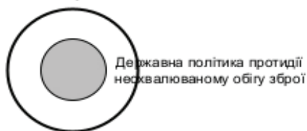
Рис. 1. Схематичне зображення співвідношення державної політики протидії злочинності та підтримання публічної безпеки та державної політики протидії несхвалюваному обігу зброї

Державна політика протидії злочинності та підтримання публічної безпеки