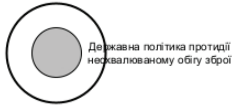
Рис 2. Схематичне зображення співвідношення сфери державної політики щодо зброї та державної політики протидії несхвалюваному обігу зброї

Державна політика протидії злочинності та підтримання публічної безпеки