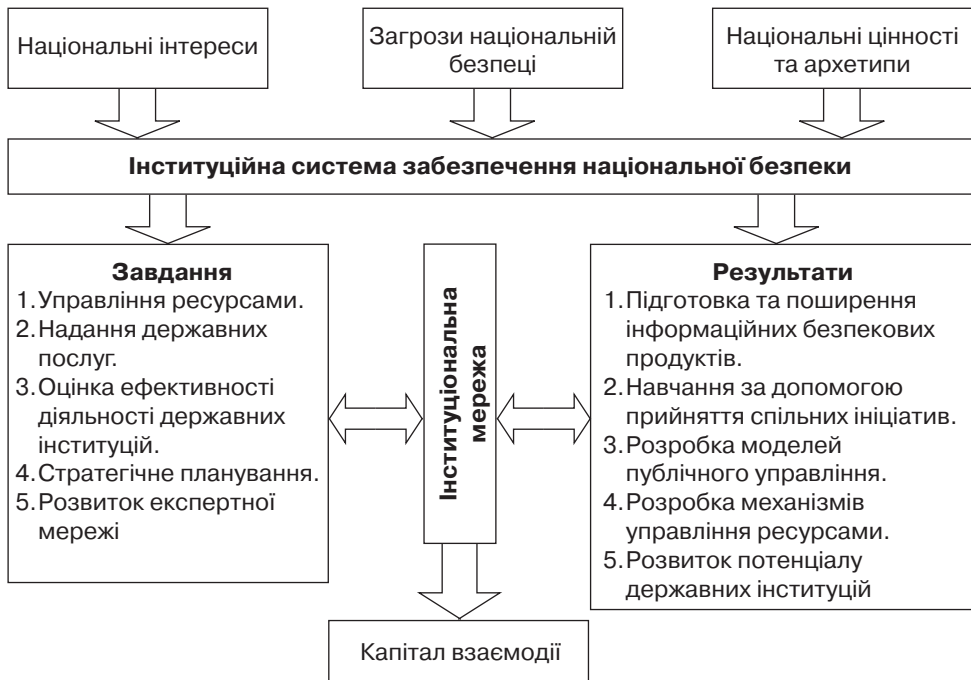
Рис. 1. Схема формування інституційних мереж у контексті безпекового підходу

Складності побудови емпіричних моделей впливу інтелектуального