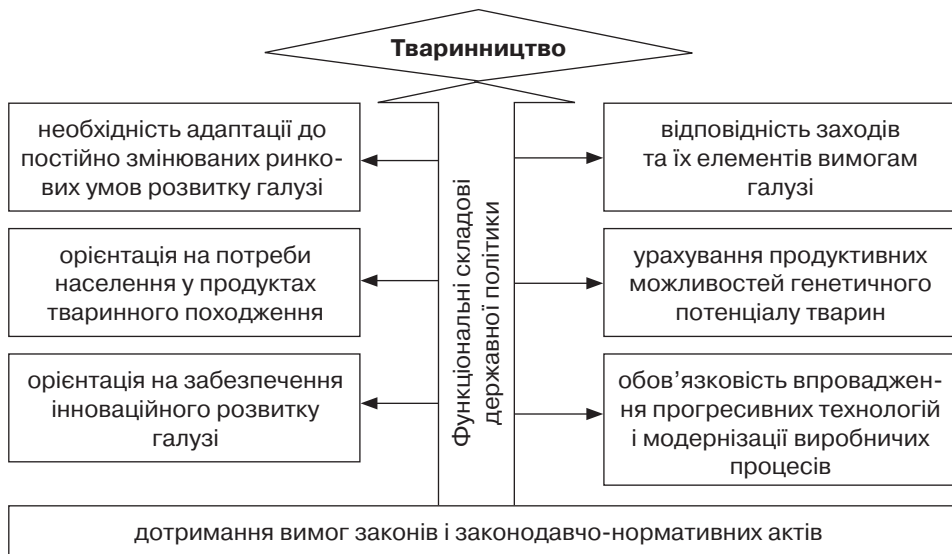
Рис. 3. Основні складові активізації функціональної спрямованості державної політики у розвитку тваринництва (розробка автора)

• раціоналізація використання джерел фінансування процесу підготовки висококваліфікованих праців-