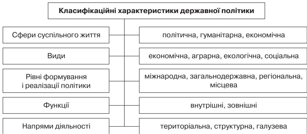
Рис. 2. Структурні класифікаційні характеристики державної політики (розробка автора)

ників, вирівнювання відмінностей у використанні виробничих ресурсів, компенсаційні виплати гірським і депресивним територіям, поширення диверсифікованих форм діяльності. Водночас галузевий напрям державної політики передбачає активізацію її функцій на інтенсифікацію і зростання масштабів виробництва, розширення підприємницької діяльності, сприяння інвестиційно-інноваційним процесам, селекційній діяльності та ін. У більшості випадків галузеві особливості тваринництва і нерегульований ринок тваринницької продукції призводить до того, що товаровиробники недоодержують значні ресурси і ефективність їх підприємницької діяльності залишається низькою [6]. Окрім цього, збереження тваринництва і розвиток його на інтенсивній основі не може відбуватися через порушення гармонізації інтересів суб'єктів господарювання (держави, товаровиробників, споживачів) [7, с. 13].