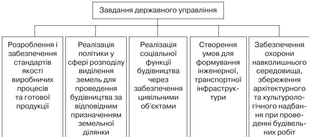
Рис. 3. Завдання державного управління щодо розвитку будівельної галузі

дження. Зокрема, поняття державного управління, яке розглядається як комплексне, системне поняття, було структуровано відповідно до структури механізмів державного управління. Саме поняття розглянуто як на рівні органів державної влади, так і на рівні безпосередньо виробничого процесу через реалізацію управлінських функцій на державних підприємствах. Аналіз нормативно-правової бази показав, що вона характеризується як загальноекономічними нормативно-правовими актами, що регламентують економічні процеси на рівні різних галузей, так і специфічними законодавчими актами, що визначають специфіку будівництва. Було визначено роль і місце органів державного управління у забезпеченні розвитку галузі будівництва та специфіку реалізації управлінських функцій на державному рівні. Серед перспектив подальших досліджень формування рекомендацій щодо розробки комплексної програми державного управління розвитком будівельної галузі.