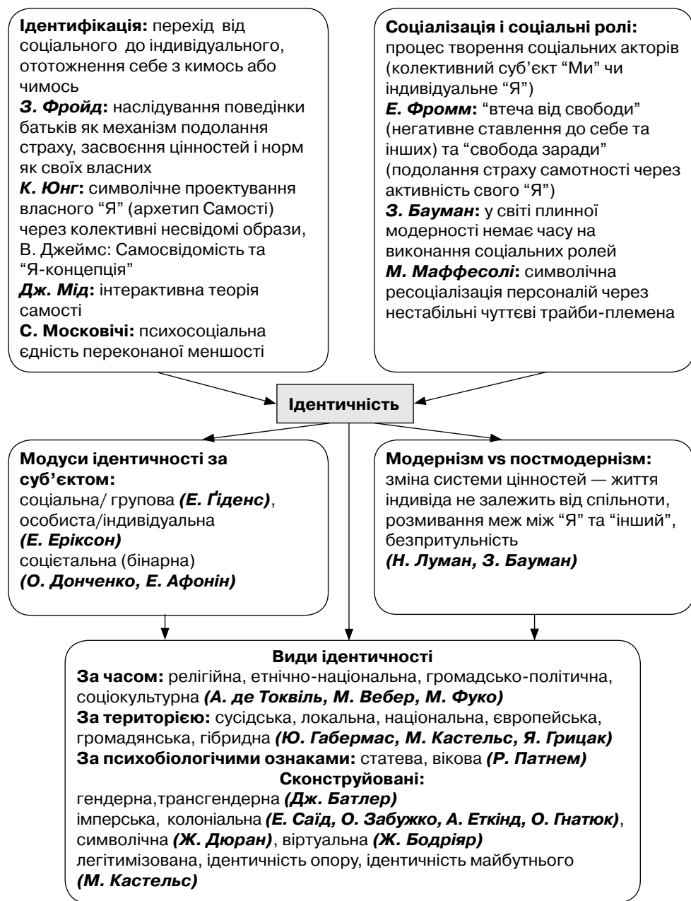
Рис. 2. Карта ідентичності

флікту залежать від сили впливу на масову свідомість конфронтуючих стереотипів, а також від соціальної дистанції, тобто (не)готовності членів спільноти вступати у відносини