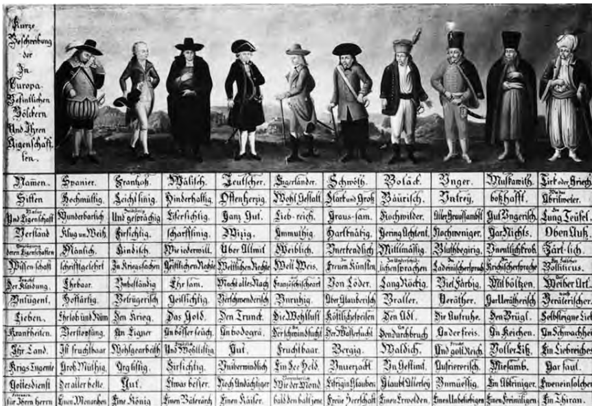
Рис 3. Короткий опис народів, які мешкають в Європі та визначення рис їхнього характеру, автор невідомий, Штирія (сучасна Австрія), поч. XVIII ст.

Наведена типізація є наочним прикладом стереотипізації народів і тих патріархальних цінностей, які існували у цей період. Тільки чоловіки могли бути представниками своїх народів на цьому історично-