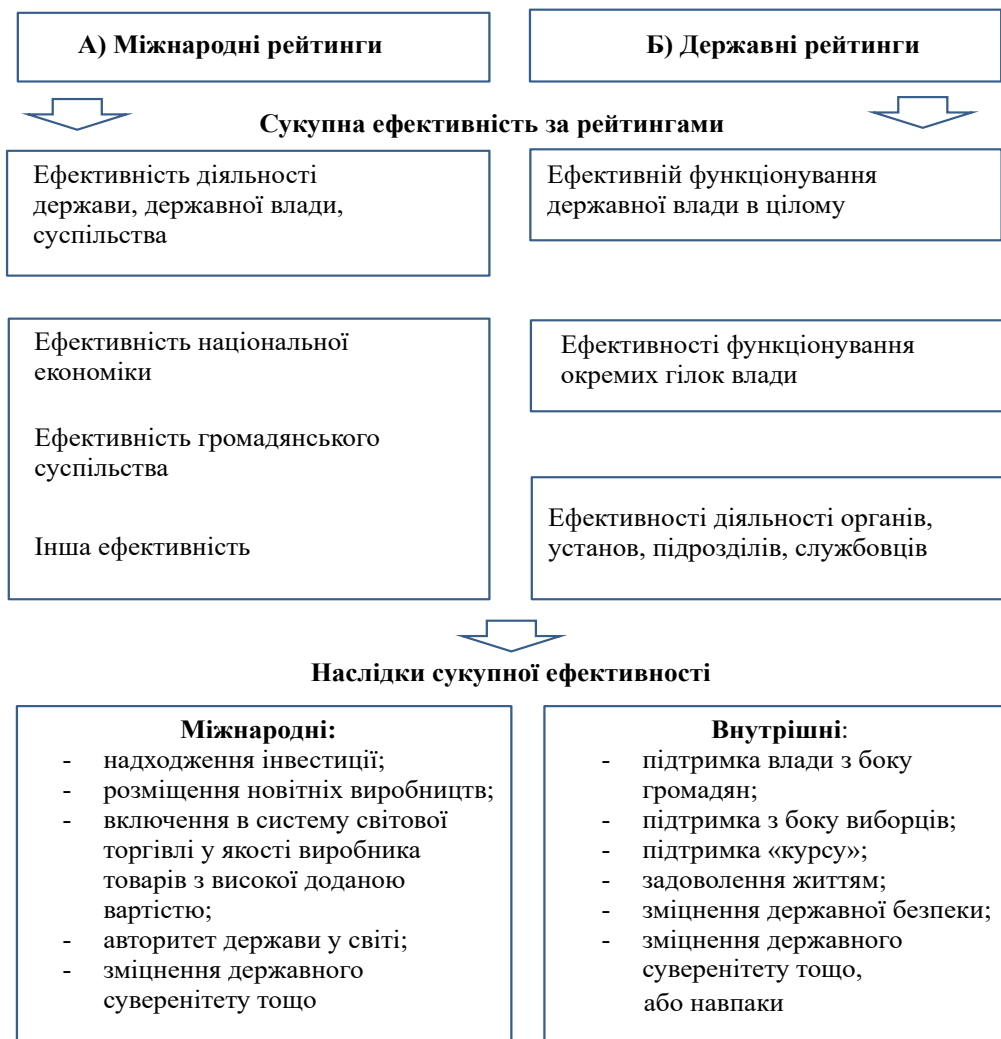
Рис. 3. Сукупна ефективність за рейтингами

– Подолання проблеми: «державна влада як річ у собі»: Важливо подолати уявлення про державну владу як щось «існуюче для себе», це і є передумовою для підвищення ефективності процесу державного управління.