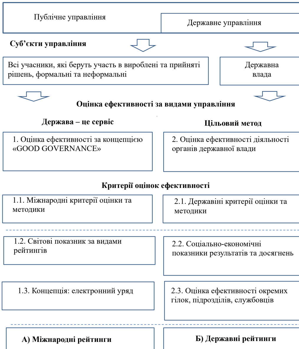
Рис. 2. Модель-схема оцінки ефективності

– Прозорість: Прозорість означає, що прийняті рішення та їх виконання здійснюються відповідно до правил та положень. Це також означає, що інформація знаходиться у вільному доступі і доступна тим, на кого впливатимуть такі рішення та їх виконання.