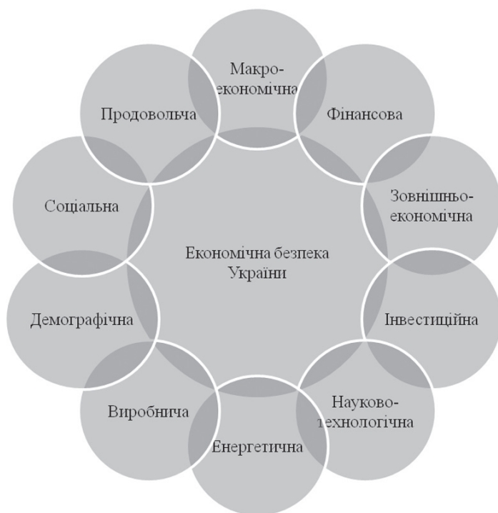
Рис. 2. Основні складові економічної безпеки України 2

загального плану (валовий внутрішній продукт, валовий національний продукт, національний дохід в абсолютному і відносному значеннях), а також динаміка і структура вітчизняного виробництва і доходу, обсяги і темпи промислового виробництва, галузева структура господарства і динаміка окремих галузей, обсяги і структура інвестицій тощо.