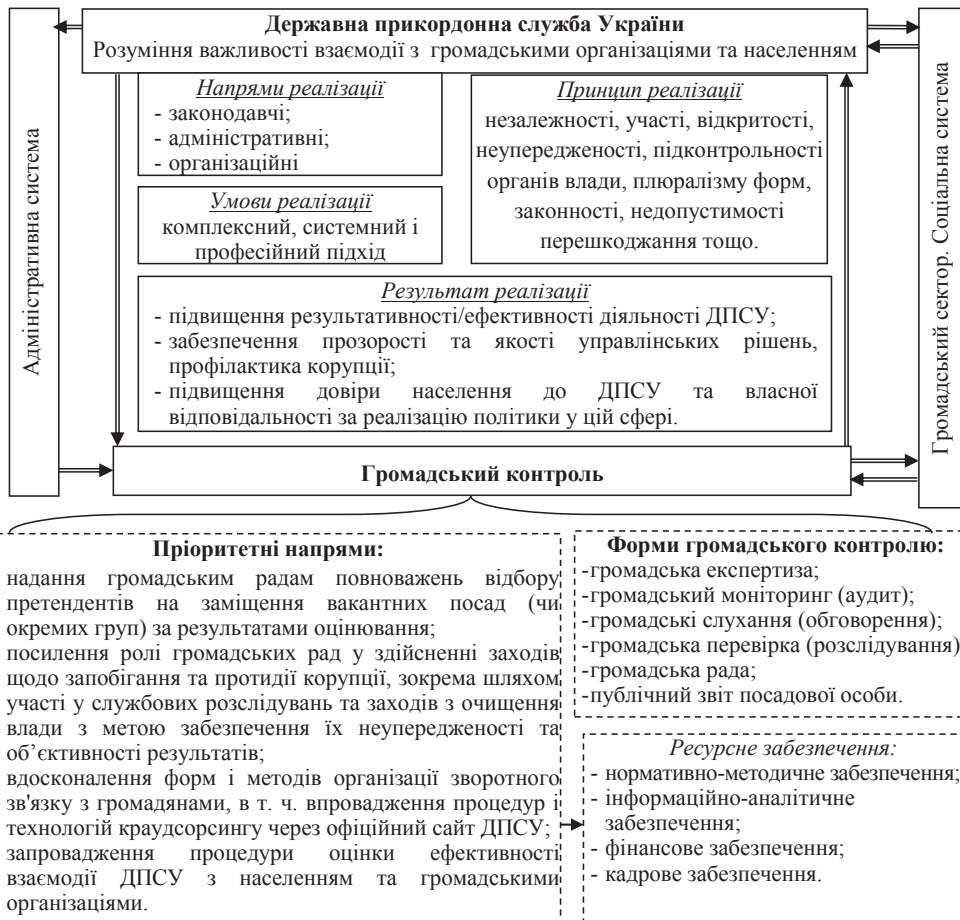
Рис. 1. Концептуальні засади розвитку громадянського контролю у Державній прикордонній службі України

Недооцінка ролі громадського контролю в забезпеченні прикордонної безпеки державними і політичними діячами, більшістю населення країни, а також самими співробітниками прикордонних органів нівелює ідею демократизації влади, розподілу повноважень та відповідальності між сторонами. Зазначене обумовлює необхідність вирішення питань налагодження конструктивного діалогу між владою та громадськістю, враховуючи всі стандарти демократичного суспільства, що актуалізує