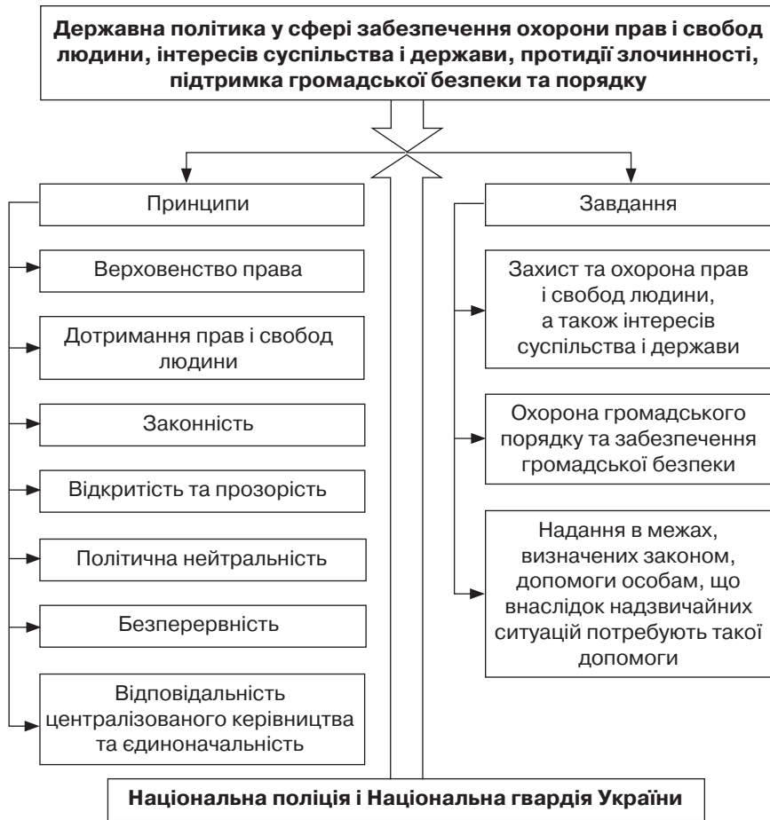
Рис. 1. Схема реалізації державної політики, що забезпечується певними інституціями державного управління на визначених принципах і завданнях

ти, як основну систему, що забезпечує взаємозв'язок таких елементів, як інституції (що реалізують зазначену державну політику), ресурси (кадрового, матеріально-технічного, природного тощо, за допомогою яких можлива реалізація державної політики), технології (вміння, знання, засоби тощо щодо реалізації державної політики), заходи (плани дій), а також впливи (загрози) зовнішні та внутрішні.