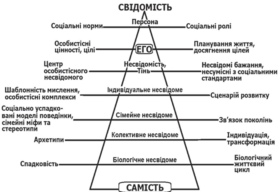
Рис. 1. Структура психіки людини за К. Г. Юнгом Джерело: Юнг К. Г. Архетип і символ / К. Г. Юнг. — 1991. — 208 с.

1. Стадія немовляти (орально-сенсорна) — конфлікт між довірою і недовірою навколишній дійсності.