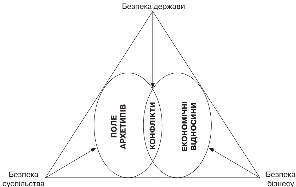
Рис. 1. Співвідношення безпекового виміру та архетипів (розроблено автором)

Економічний стан України є віддзеркаленням основних архетипів та протиріч у впливі глибокого архетипу “Поле”, що показує розуміння відповідного місця нації у Всесвіті. Історичний досвід нашої країни призвів до відсутності універсальних елементів національної єдності. Це відображено у деформованому та суперечливому емоційному економічному мисленні, яке зокрема одночасно сполучає згоду (іноді просто зовнішню) з політикою економічних змін зі сформованими соціальними стереотипами. Загалом же ми можемо відзначити історично сформовану гіперболізацію зовнішніх факторів, чим й зумовлена сучасна швидка “вестернізація” способу життя українців та розмиття традиційних рис ментальності. В. Межуєв [11] відзна-