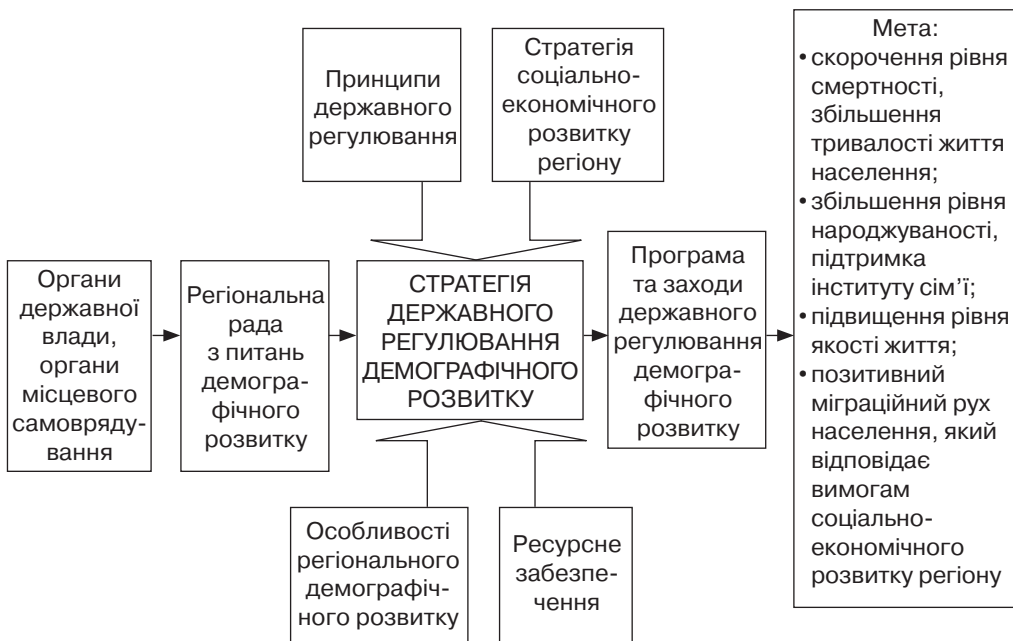
Рис. 2. Організаційний (інституційний) механізм державного регулювання демографічного розвитку

2. Аналіз відносини молодих людей до заходів регуляторного впли-