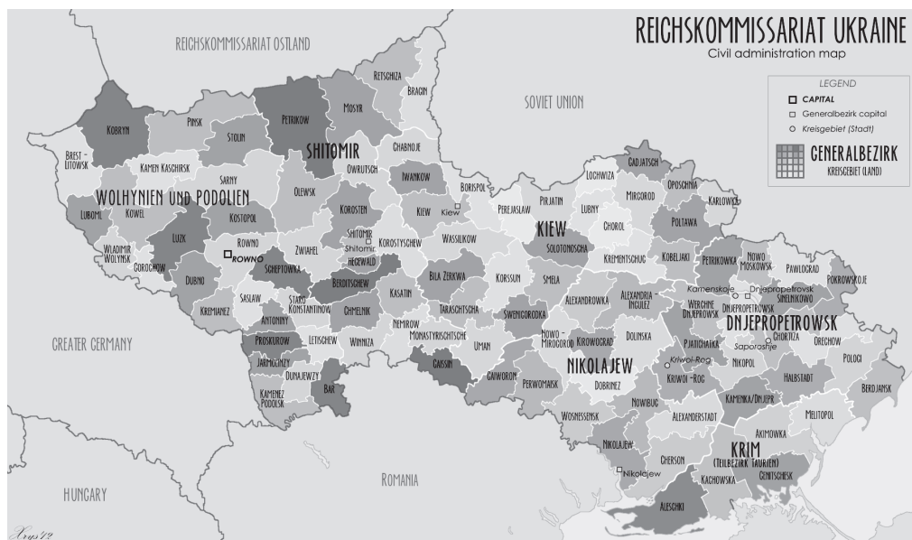
Рис. 1. Мапа Рейхскомісаріату “Україна”

комісарами, причому на перші дві посади призначав особисто фюрер, а керівників головних управлінь рейхскомісаріату, а також гебітскомісарів — рейхсміністр у справах окупованих східних областей.