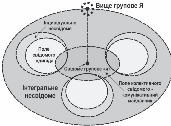
Схема 2. Модель колективного суб'єкта

Запропонована модель добре корелює з уявленнями Лебона про психологію натовпів, зокрема з його “психологічним законом духовної єдності натовпу”, в якому йдеться про те, що за певних обставин зібрання людей набуває цілковито нових рис, що відрізняються від тих, які характеризують окремих індивідів, що беруть участь у цьому зібранні [4]. Причому Лебон вважав, що чисельність натовпу може починатися з кількох людей, які, зібравшись разом, втрачають здатність до критичного мислення, яким усі вони володіють наодинці.