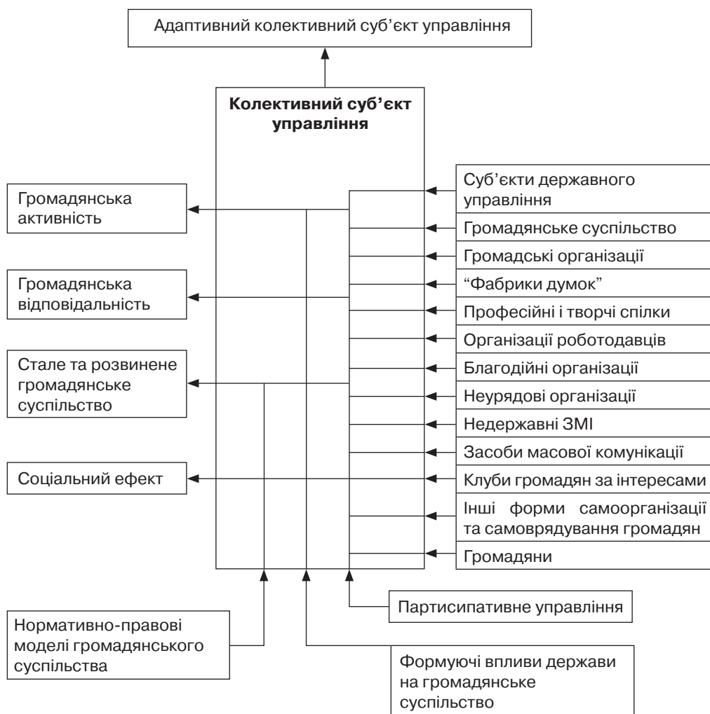
Рис. 1. Створення адаптивного колективного суб'єкта управління на основі формуючих впливів держави на громадянське суспільство

Ефективність управління через формуючі впливи визначається масштабільністю змін; оцінюється за кількістю елементів, що зазнали впливу, та за ступенем істотності викликаних змін; закріпленням у свідомості людей мислительно-вольових імпульсів; формуванням відповідної моделі поведінки.