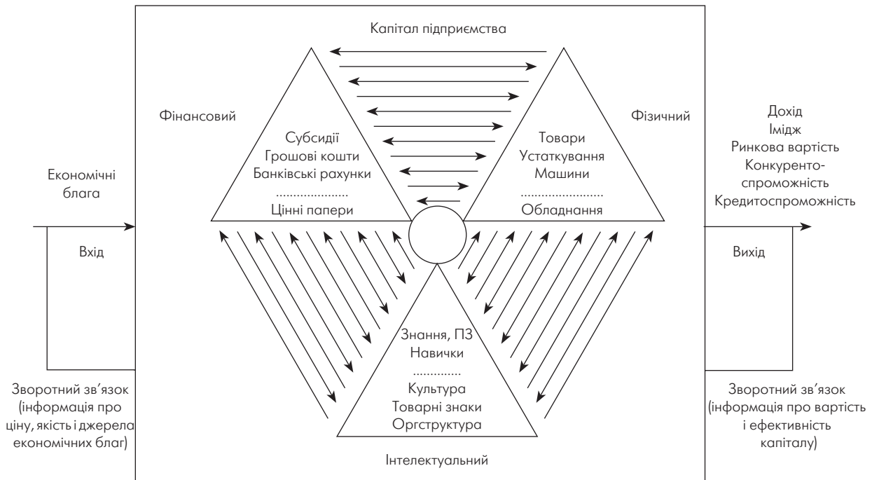
Рис. 1. Структура системи “капітал підприємства”

шляхів функціонування та розвитку пояснюється, по-перше, тим, що у стані, близькому до рівноважного, досягти певної мети можна кількома шляхами, а по-друге, у стані, далекому від точки рівноваги і близькому до біфуркації, перед системою відкривається поле шляхів розвитку, яке має безліч векторів, тобто безліч альтернатив.