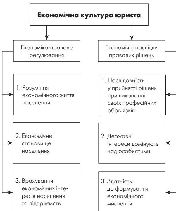
Рис. 1. Складові економічної культури юриста на макрорівні

Особливе значення економічна культура має в одній із складних сфер діяльності фахівця — у правовому полі (рис. 1).