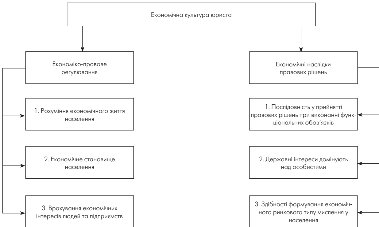
Рис. 1. Значення економічної культури юриста на макроекономічному рівні

У цьому плані можна вказати на деякі дослідження економічної культури юриста: спробу мобілізувати освітні системи до ефективної діяльності із розробки економічної формули юриста як з врахуванням потреб ринку, так і впровадженням здобутих досягнень у практику. Дослідження питань економічної культури розглядали більш широке розуміння юристом сутності економічних реформ, які відбуваються в державі; захист вітчизняного виробника в процесі виконання своїх професійних обов'язків [7, 10, 12, 15] (рис. 2).