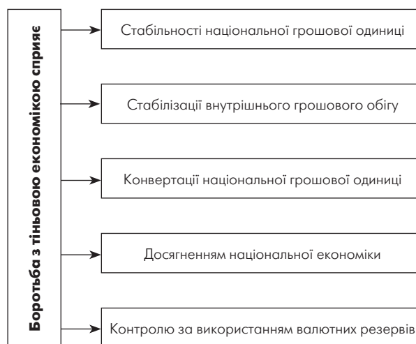
Рис. 3. Макроекономічні показники, які розвиваються, коли відбувається боротьба з тіншовою економікою

міки, зростання злочинності, які, зрештою, призводять до втрати суспільної моралі в державі і безперспективності розвитку суспільства. В умовах ринкової економіки економічна культура має принципово важливе значення для всіх категорій громадян: від школярів до робітників і службовців усіх сфер діяльності; військових і осіб пенсійного віку. Як зазначають вчені, політики [4, 6, 7, 12, 16], ринкова безграмотність, особливо фахівців юридичного профілю, сприяє породженню корупції, тіншової економіки, зростанню злочинності. Саме на ці ознаки вказує економічна культура, точніше, — її відсутність (рис. 3).