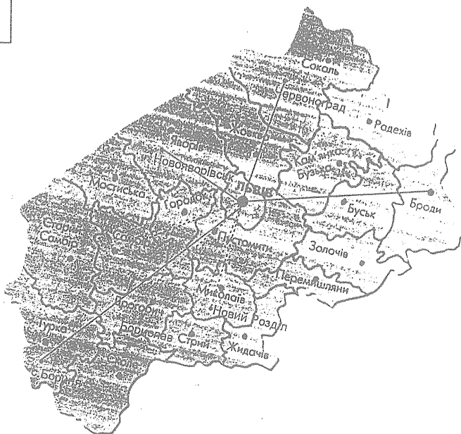
Рис. 4. Інформаційно- та інноваційно-освітні осередки у районах Львівської області: суцільні лінії — створені осередки; штрихові лінії — осередки створюються

З метою створення однакових можливостей для молоді та інших категорій населення області в одержанні якісної освіти та інтелектуальних послуг при філії за сприянням Львівського ЦНТЕІ, Львівського крайового товариства "Рідна школа", Львівської обласної малої академії наук відкриті інформаційно- та інноваційно-освітні осередки у містах Червонограді, Новояворівську, Бродях, с. Бориня Турківського району. Планується відкриття таких осередків у містах Новому Роздолі, Бориславі, Стрию, Самборі, Старому Самборі, Дрогобичі (рис. 4).