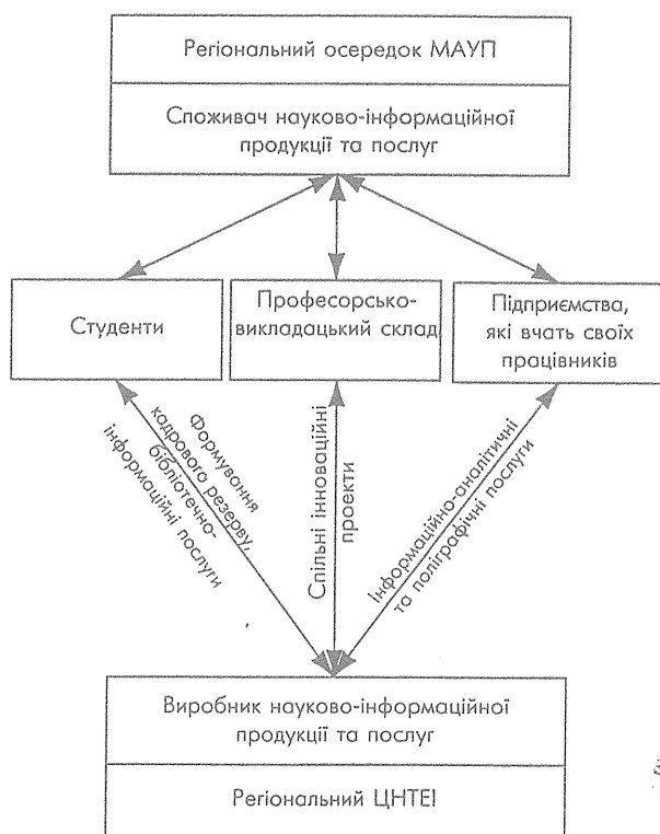
Рис. 2. Організаційно-функціональна схема співпраці регіонального ЦНТЕІ з навчальною структурою (на прикладі МАУП)

З метою перепідготовки спеціалістів та отримання вищої освіти, а також формування корпоративного середовища нових користувачів інформації Львівського ЦНТЕІ у 1997 р. почалася співпраця з Міжрегіональною Академією управління персоналом (МАУП). Унаслідок цього на базі Львівського ЦНТЕІ відкрився навчально-консультаційний центр (НКЦ) дистанційного навчання МАУП, в якому отримали другу вищу освіту 33 особи. Це також дало можливість центру цілеспрямовано накопичувати інформаційні ресурси, модернізувати майновий комплекс, ефективніше використовувати глобальну комп'ютерну мережу Інтернет, формувати і реалізувати спільні просвітницькі проекти (семінари, конференції, виставки, курси іноземних мов і т. ін.) (рис. 2).