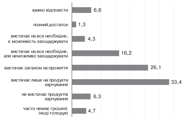
Рис. 2. Розподіл респондентів за матеріальним станом, (%)

Група відповідей, яку можна класифікувати як відносно задовільний рівень матеріального забезпечення (позиції “вистачає загалом на прожиття” (26,1 %) та “вистачає на все необхідне, але неможливо заощаджувати” (16,2 %), — в сумі дає 42,3 %.