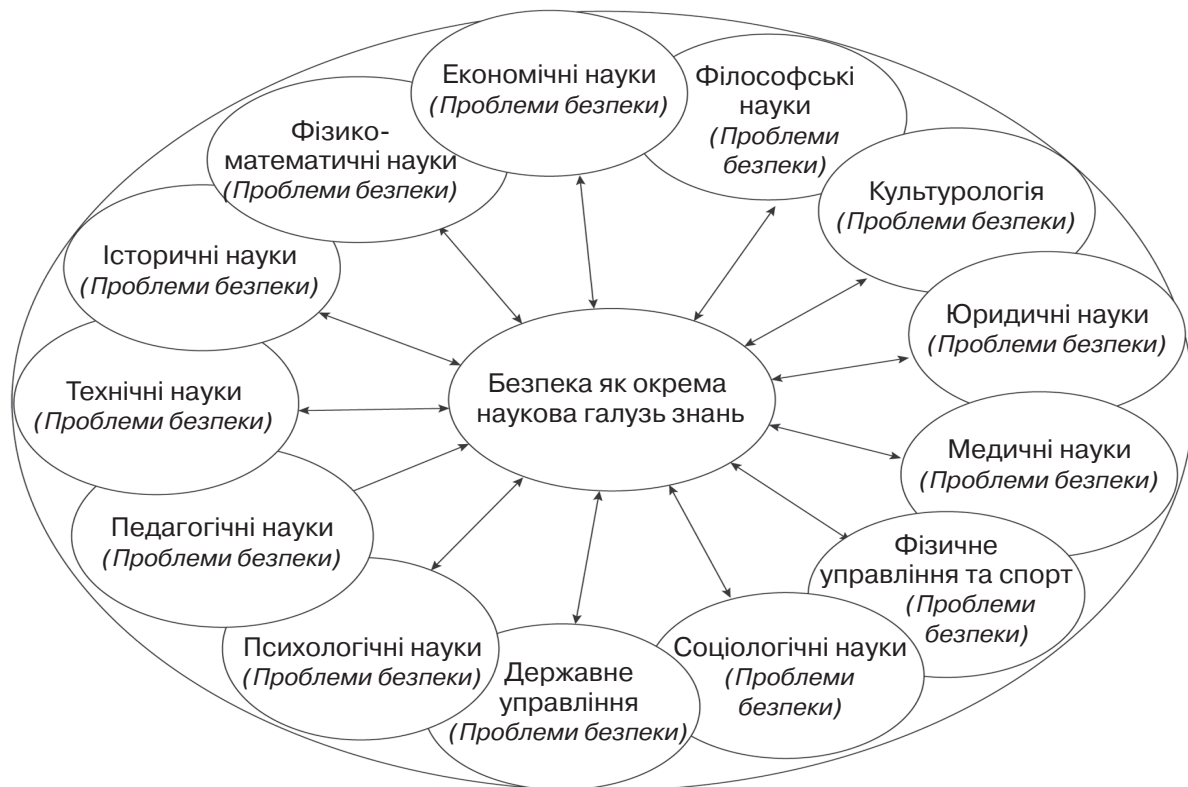
Рис. 1. Безпека як інтегральна галузь наукових знань

Розглядаючи національну безпеку як окрему наукову галузь (рис. 1.), ми маємо зро-