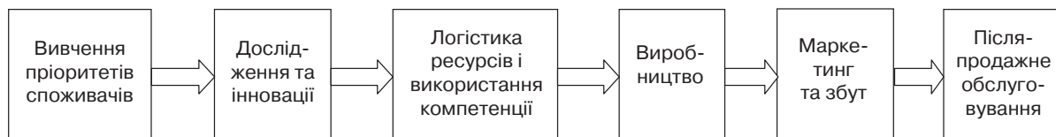
Рис. 3. Трансформований ланцюжок створення цінності [6]